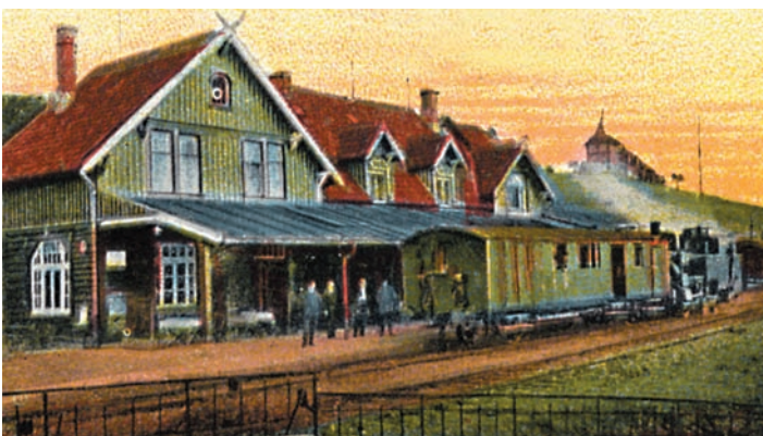
So sah der Stadtbahnhof in Sankt Andreasberg aus.

Alle Informationen von: www.werkbahn.de/eisenbahn/zahnrad